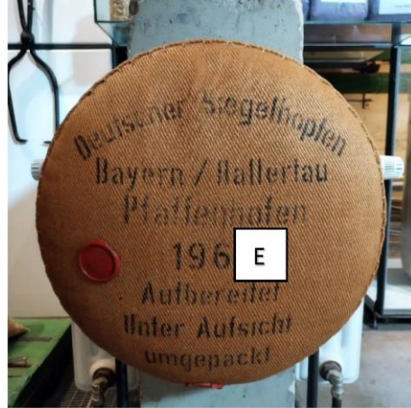
E: Letzte Ziffer der Jahreszahl