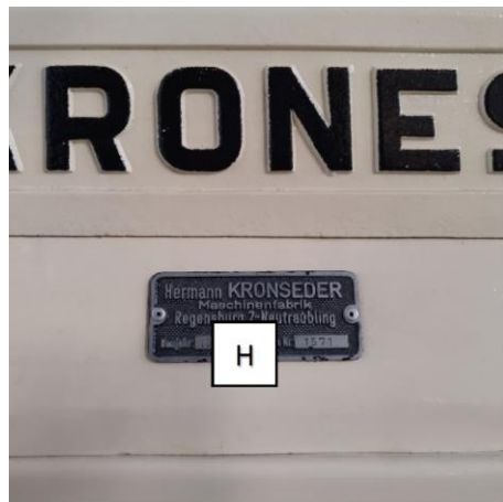
H: Letzte Ziffer des Baujahrs