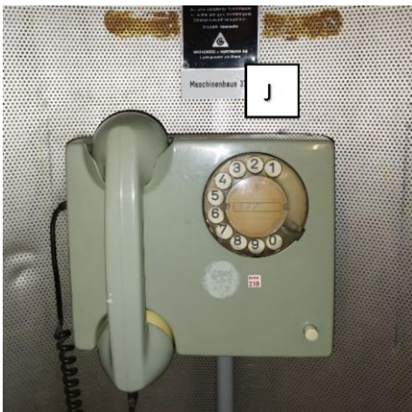
J: Letzte Ziffer der dreistelligen Zahl