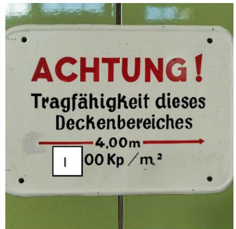
I: Erste Ziffer der dreistelligen Zahl