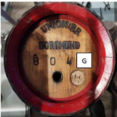
G: Letzte Ziffer der vierstelligen Zahl