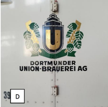
D: Dritte Ziffer der dreistelligen Zahl