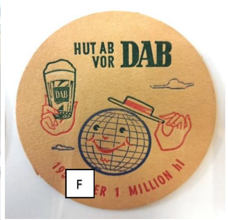
F: Letzte Ziffer der Jahreszahl