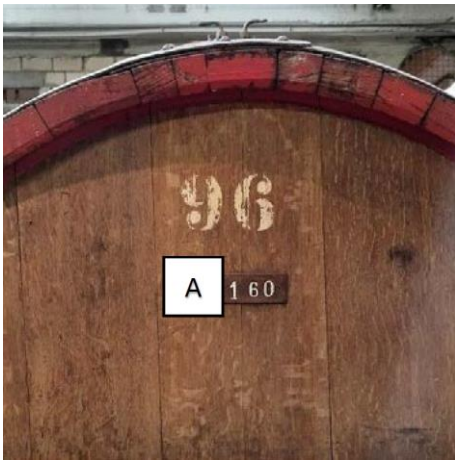
A: Erste Ziffer der vierstelligen Zahl